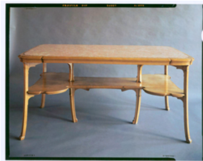
Dation / datiedeed Gillion Crowet – Bruno Piazza © MRBC-MBHG / MRBAB-KMSKB

Het meubilair is onder meer afkomstig van het Hortamuseum, de Koninklijke Musea voor Kunst en Geschiedenis, de schenking Gillion Crowet en de verzamelingen van de familie Wittamer.