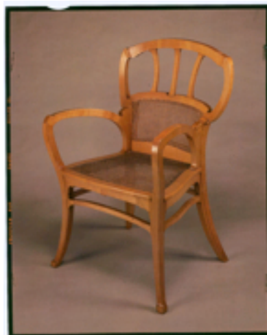
Dationdatiedeed Gillion Crowet – Bruno Piazza

Deze tentoonstelling in de Koninklijke Musea voor Schone Kunsten van België is vrij toegankelijk.