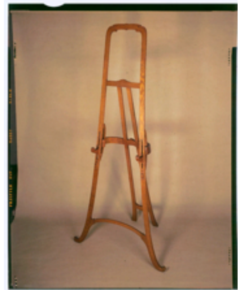
Dationdatiedeed Gillion Crowet – Bruno Piazza

Voor deze tentoonstelling worden een deel van het meubilair en de archiefplannen samengebracht, waardoor we ons een volledig beeld kunnen vormen van hoe het gebouw er toen uitzag. Zo zijn in de zalen Boël en Bernheim van de Koninklijke Musea voor Schone Kunsten een twintigtal meubelstukken voor het publiek te bezichtigen.